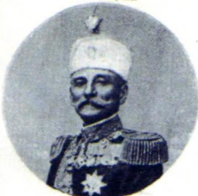
Сербскiй король Петръ I.