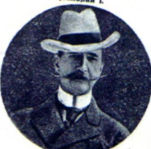
Георгъ I, король греческiй.