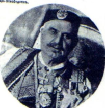
Король черноморскiй Николай I.