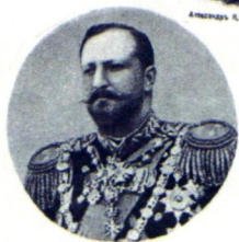
Фердинандъ, царь болгарскiй.