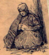
Участие газеты «Черное Звонко».

Дневникъ и сорокъ девять любительскiхъ фотографiй, Ал. Пилленко.