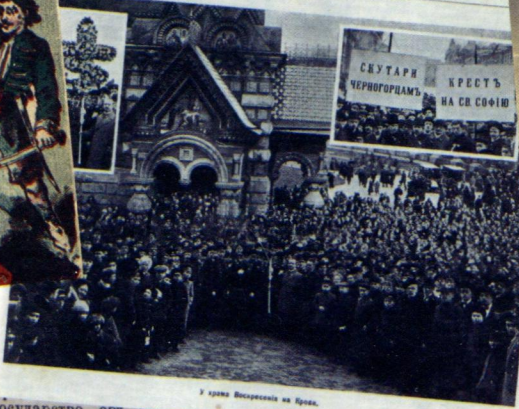
У храма Воскресенiя на Крестъ.