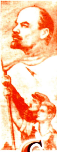
Рисунг чертёжника (имя не указано)

Одновременно с началом работы в этом году мы приступаем к изданию нового номера газеты «Красное Прикамье». В этом номере мы публикуем материалы, посвященные 50-летию Великой Октябрьской социалистической революции. Мы хотим напомнить вам о том, что именно в этот день в России началось строительство нового общества — общества социализма. Мы хотим напомнить вам о том, что именно в этот день в России началось строительство нового общества — общества социализма.