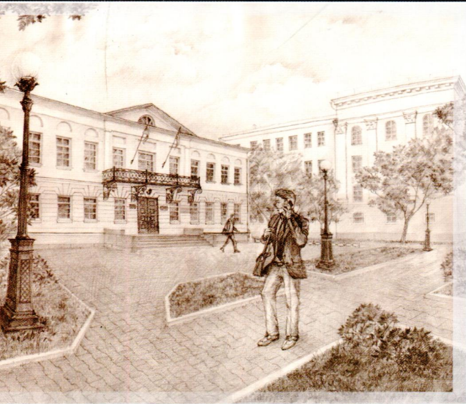
Рис. Маркиной Д.В. 2017 г.