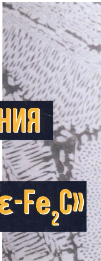
ДИАГРАММА СОСТОЯНИЯ СПЛАВОВ СИСТЕМЫ «ЖЕЛЕЗО – КАРБИД \epsilon\text{-Fe}_2\text{C} »