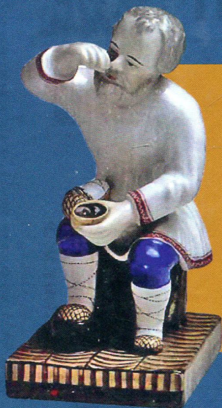
Крестьянин, плетущий лапоть