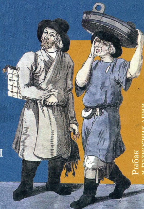
Рыбак и разносчик дичи

Из истории конструирования этничности. Век XIX