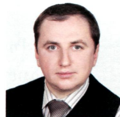
ДУБОВИК Антон Викторович , начальник Управления бюджетного учета и отчетности Казначейства России