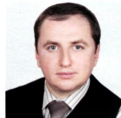
ДУБОВИК Антон Викторович , начальник Управления бюджетного учета и отчетности Казначейства России