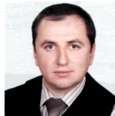
ДУБОВИК Антон Викторович , начальник Управления бюджетного учета и отчетности Казначейства России