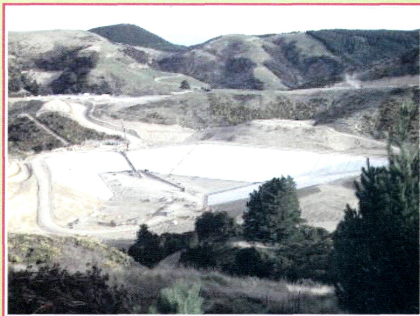
Обустройство полигона с применением бентонитовых матов SETCO

Иллюстративный материал к статье компании «ТеМа»: «Экологичные полигоны твердых бытовых отходов – от разговоров к практике»