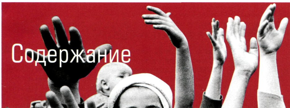
ОБЛОЖКА: СЕРГЕЙ ЖЕГЛОВ.