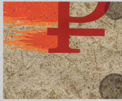
КОллаж: Кирилл Рубцов

Избыточная подвижность курса подбивает функцию рубля как средства сбережения. Не случайно с весны 2013 года фактически остановился рост депозитов населения в банковской системе в реальном выражении, а доля валютных вкладов медленно, но верно ползет вверх, к началу осени вплотную подобравшись к 20-процентной отметке. Мало того, ЦБ развернул безжалостную чистку банковской системы, да еще курс пляшет, как укушенный. Для хозяйственных игроков высокая неопределенность краткосрочной динамики курса также контрпродуктивна — снижает надежность инвестиционных планов либо требует затратного хеджирования.