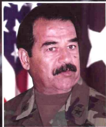
Саддам Хусейн Президент Ирака