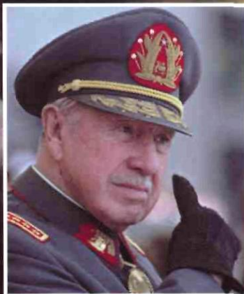
Аугусто Пиночет Президент Чили