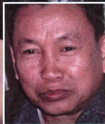
Пол Пот Вождь режима кампучий- ских «красных кхмеров»