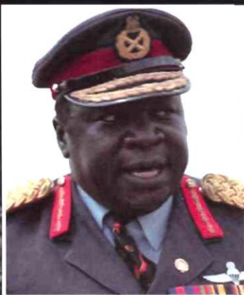
Жан Бедель Бокасса Президент Централь- но-Африканской республики