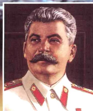
Иосиф Сталин Верховный главноко- мандующий ВС СССР