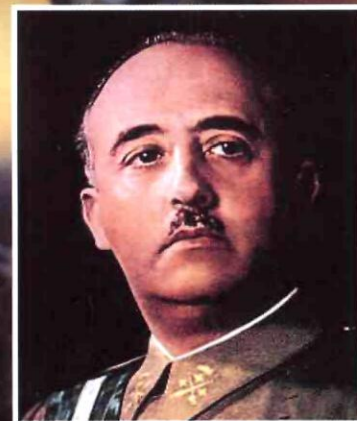
Франциско Франко Каудильо Испании