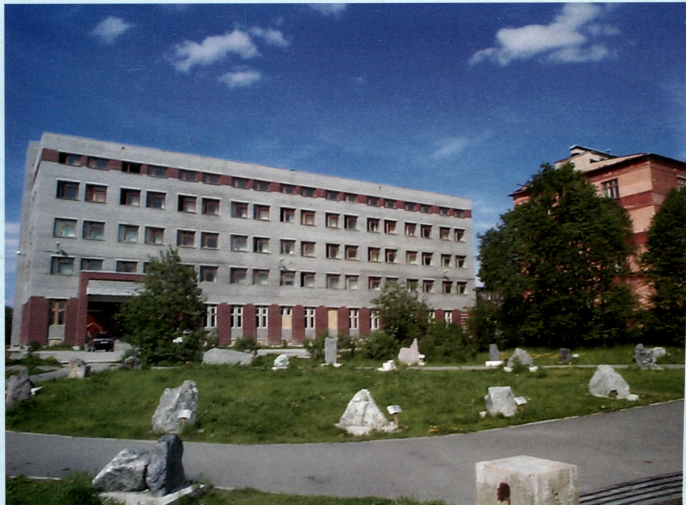
Здание ИИММ КНЦ РАН с 1996 г.

Институту информатики и математического моделирования технологических процессов Кольского научного центра Российской академии наук 25 лет