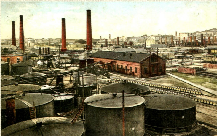
Баку. Завод в черном городе