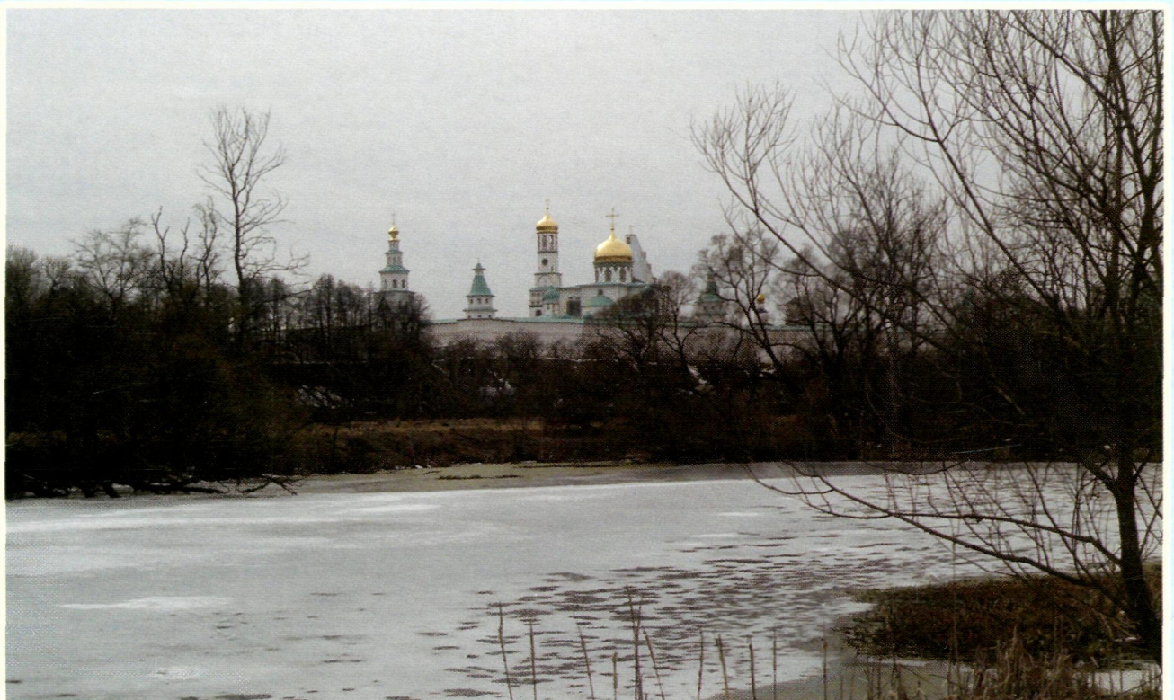
Ново-Иерусалимский монастырь. Вид со стороны дальнего берега пруда.