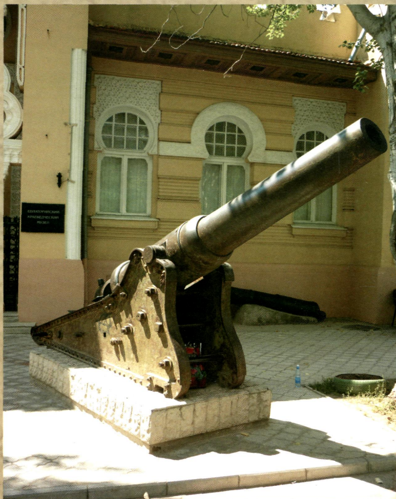
Пушка конца XIX в. (Установлена у здания Краеведческого музея г. Евпатория)

Иллюстративный материал к статье Бобкова В.А. «Военно-техническое сотрудничество России с иностранными государствами в области производства артиллерии во второй половине XIX в.»