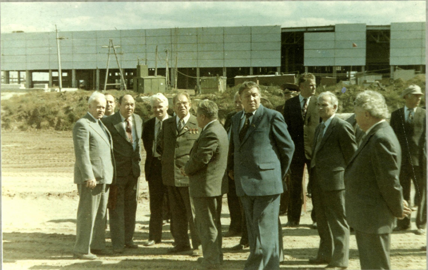
Посещение УАПК министром обороны СССР маршалом Д.Ф. Устиновым. Третий слева – Ф.З. Абдулин, пятый слева – Д.Ф. Устинов. Август 1983 г. ( публикуется впервые )

Иллюстративный материал к статье Бурдина Е.А., Прохорова А.В. «Авиагигант на Волге: становление Ульяновского авиационного промышленного комплекса (1975–1985 гг.)»