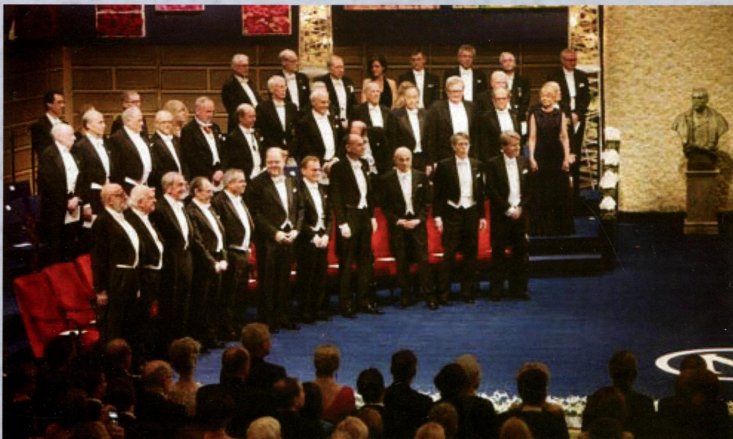
Лауреаты Нобелевской премии 2013 г. на сцене Концертного зала Стокгольма во время церемонии награждения