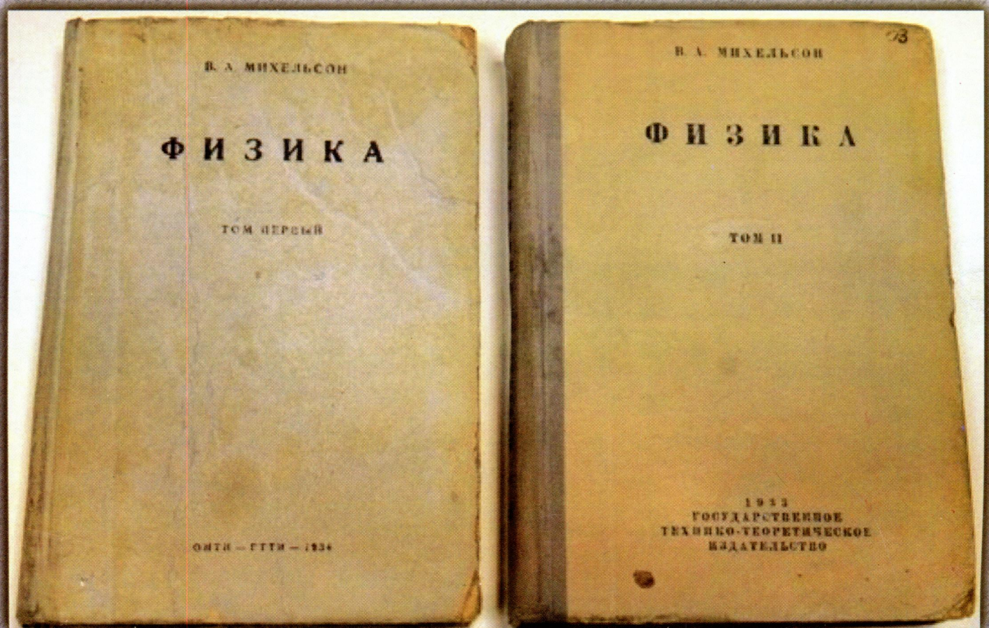
Рис. 7. Двухтомный курс физики В.А. Михельсона

Иллюстративный материал к статье Смык А.Ф., Пауткиной А.В. «ВУЗовский учебник физики как объект изучения истории физики»