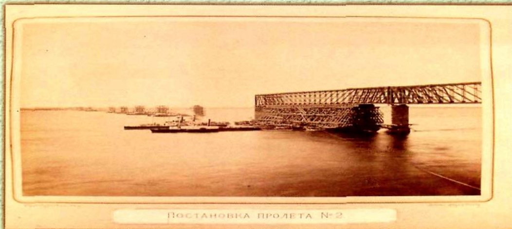
Постановка пролета № 2

Александровский мост через р. Волгу у г. Сызрани, построенный по проекту Н.А. Белелюбского. 1875–1880 гг. Постановка пролета № 2. РГИА. Ф. 350. Оп. 92. Д. 55. Л. 18