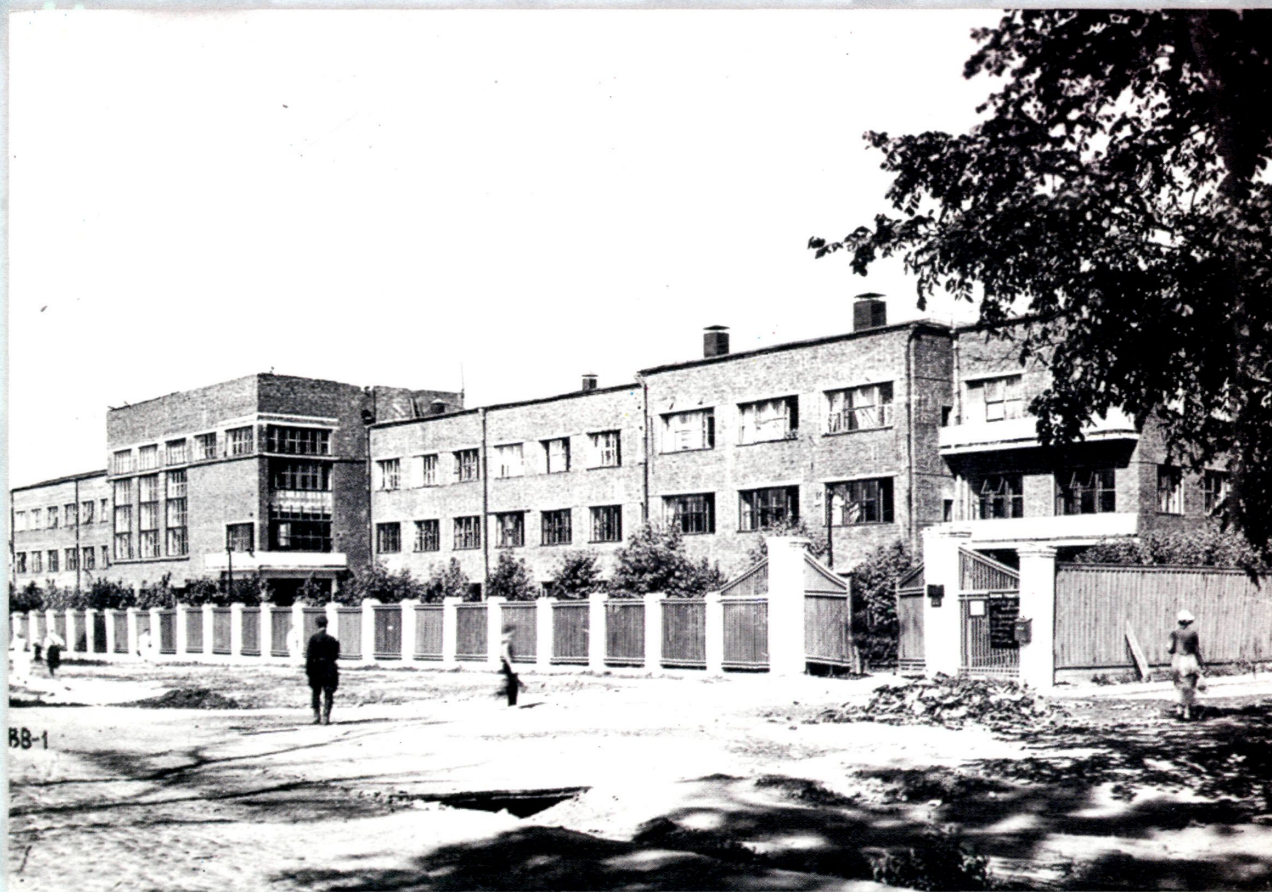
Всесоюзный научно-исследовательский институт сельскохозяйственного машиностроения. Фото. 1934 г. Автор не известен. РГА в г. Самаре. Ф. Р-67. Оп. 2-1 . Д. 1150. Л. 43

Источниковедение. Публикация документов из фондов Российского государственного архива в г. Самаре