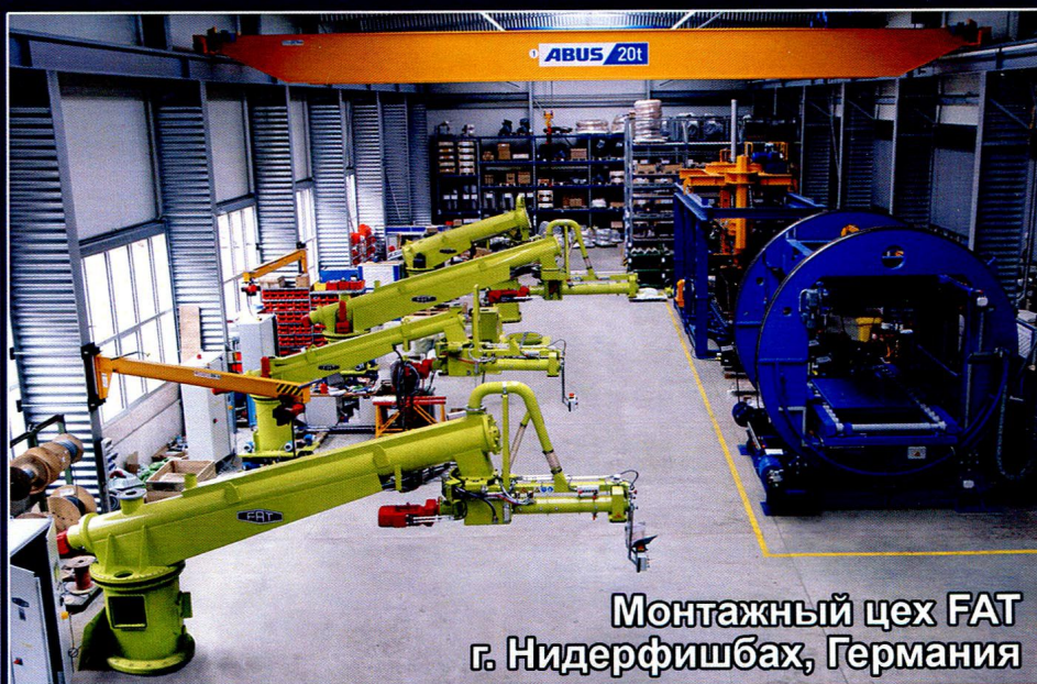
Монтажный цех FAT г. Нидерфишбах, Германия