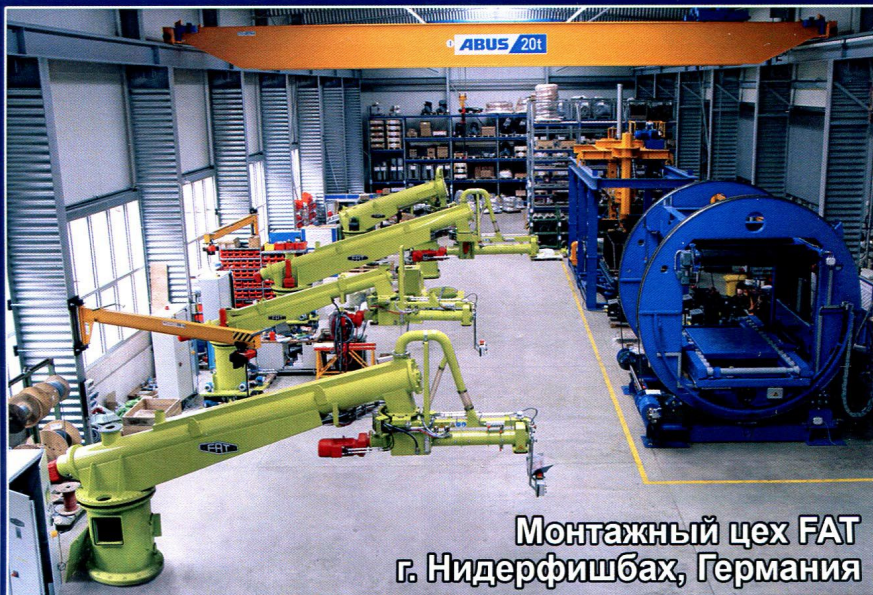
Монтажный цех FAT г. Нидерфишбах, Германия