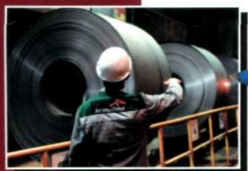
У Миттала фаворитов нет