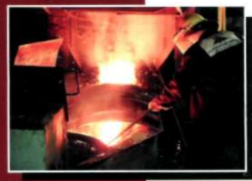
Никель в руде и металле