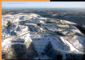
Месторождения для нового бизнеса