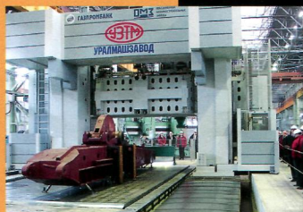
Как живешь, Уралмаш?