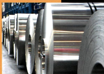
Сталь Европы включает «стоп-сигнал»