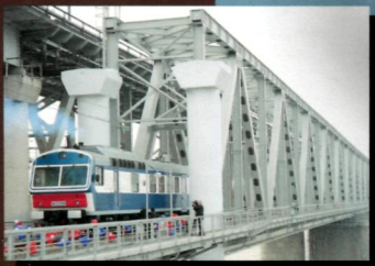
Хабаровск расширяет «окно» на восток