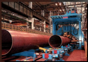
Трубная отрасль на платформе новых технологий

Первые шаги ЕАЭС: результаты будут позже