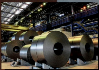
ММК: высокая отдача инвестиций