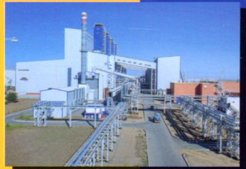
На уровне мирового прогресса