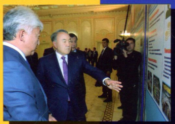
Проекты новой индустриализации