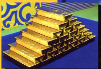
Золотой цех государства