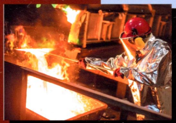
Чистая медь РМК