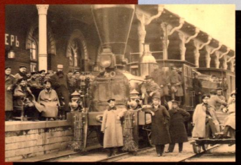
Секреты русской колеи