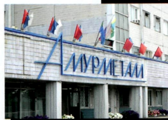
«Амурсталь» притягивает пом

Железные дороги России: пора включать скорость