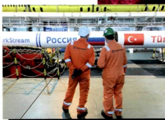
Газовые потоки и политические преграды