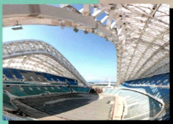
Наследство большого футбола