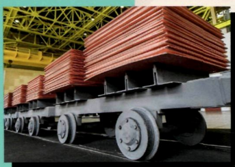
Новый цех прибавляет мощь