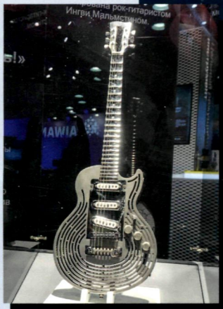
Звук высоких технологий