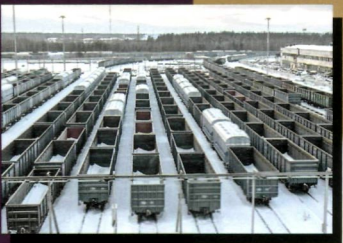
Вагоностроение на пике спроса