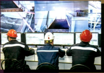
Уникальный комплекс Магнитки