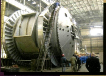
НКМЗ – надежный партнер металлургов