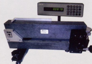
Экзаменатор эталонный I разряда М-055