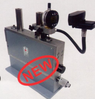
Прибор для поверки головок ППГ-4

195251, Санкт-Петербург, Политехническая ул., д.29 Тел. (812) 981-49-65, тел./факс: (812) 591-66-61 E-mail: imcmikro@mail.ru www.imcmikro.ru