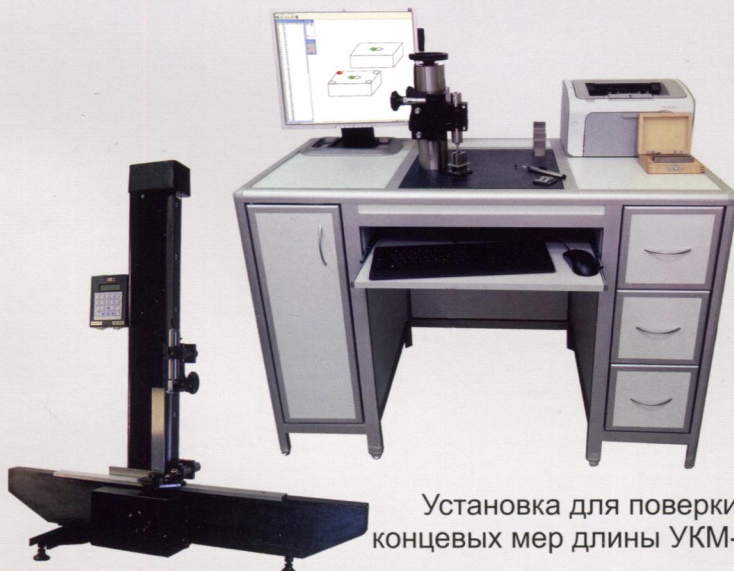
Установка для поверки концевых мер длины УКМ-100