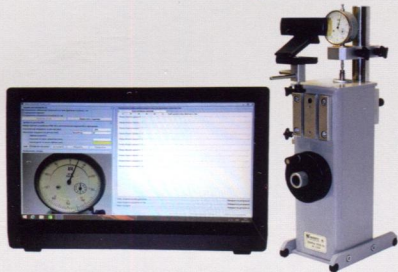
Прибор для поверки индикаторов ППИ-50

Разработчик и производитель - Инженерно-метрологический центр "Микро"