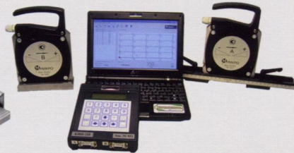
Уровни электронные М-050