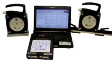
Уровни электронные М-050