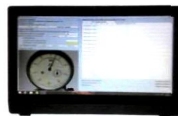
Прибор для поверки индикаторов ППИ-50