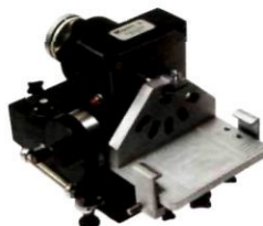
Прибор для поверки квадрантов ППК