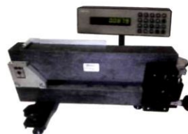
Экзаменатор эталонный I разряда М-055