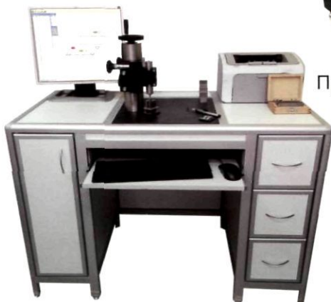
Установка для поверки концевых мер длины УКМ-100