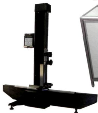
Прибор для поверки угольников ППУ-630