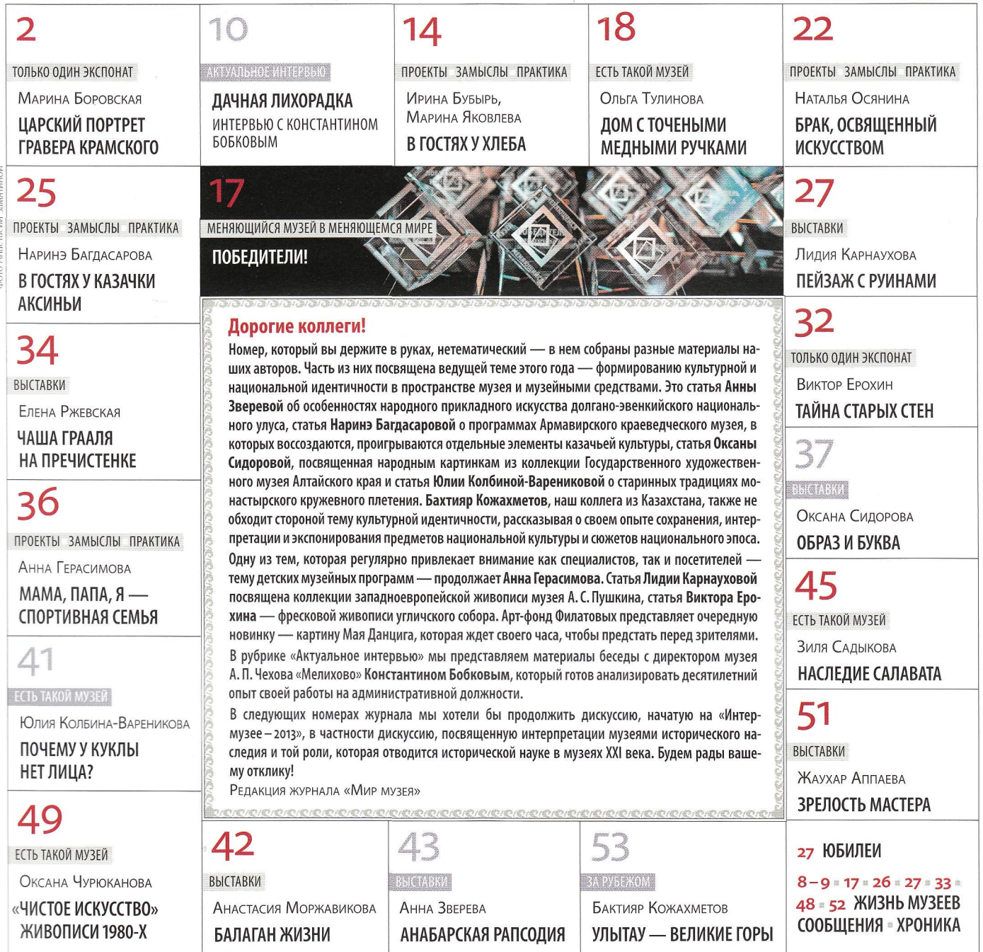
Фото Анастасии Замлинской

© АНО Редакция журнала «Мир музея», 2013.