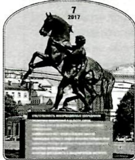
Интеллектуальная собственность в эпоху кризиса