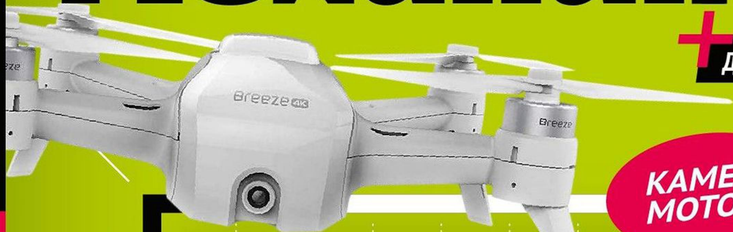
[ YUNEEC BREEZE ]