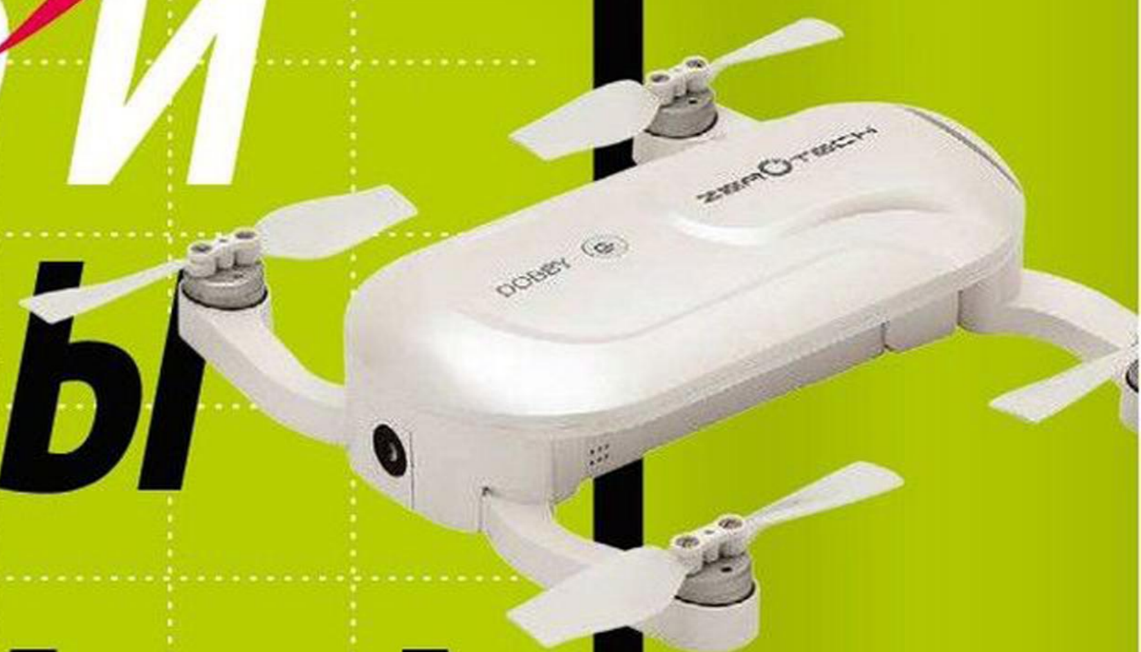
[ ZEROTECH DOBBY ]