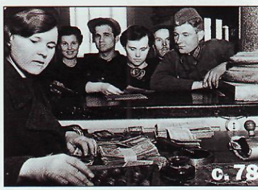
Герои тыла — ветераны Сбербанка

Могут ли наука и образование быть эффективными? с. 20