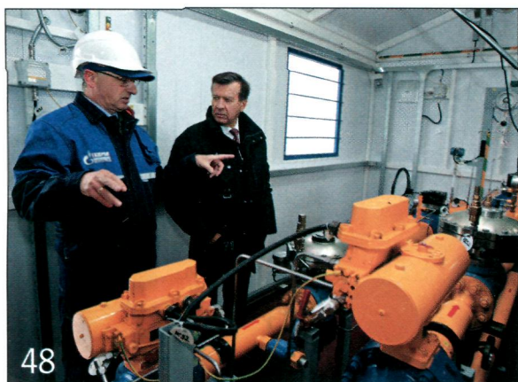
ОАО «КРАСНАЯ ПОЛЯНА»