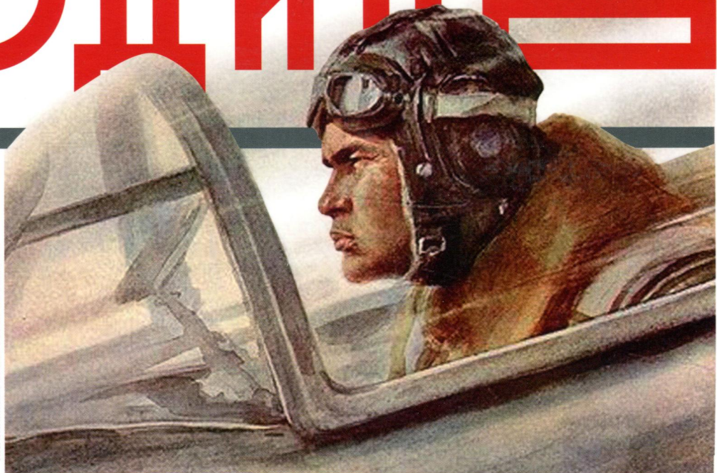
РИСУНОК НИКОЛАЯ ЖУКОВА. АЛЕКСЕЙ МАРЕСЬЕВ. 1991 г.

РАССКАЗ ЛЕТЧИКА, ЕЩЕ НЕ ГЕРОЯ ЗНАМЕНОЙ «ПОВЕСТИ О НАСТОЯЩЕМ ЧЕЛОВЕКЕ», ПУБЛИКУЕТСЯ ВПЕРВЫЕ