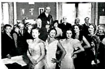
Она здравствует «МИСС РОССИЯ»

Все эти годы он вел размеренную жизнь европейского буржуа — путешествовал, ходил в музеи, театры, кинематограф, библиотеки. Летом отдыхал на дачах у знакомых. Любил велосипедные прогулки, коллекционировал марки. И почти ничем не был связан с Отечеством, которое в октябре 1917 года поставит на дыбы