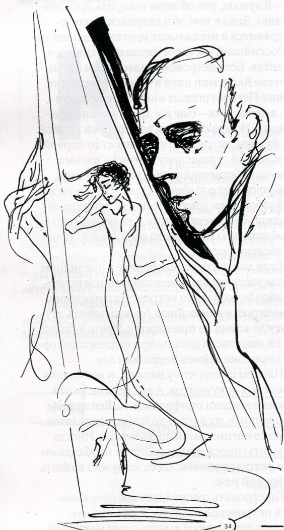
РИСУНОК ЕЛЕНА ШПИЛЦОВОЙ