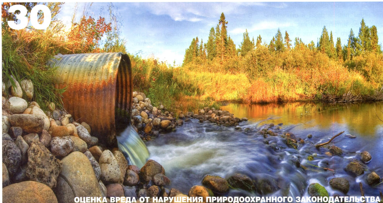
ОЦЕНКА ВРЕДА ОТ НАРУШЕНИЯ ПРИРОДООХРАННОГО ЗАКОНОДАТЕЛЬСТВА