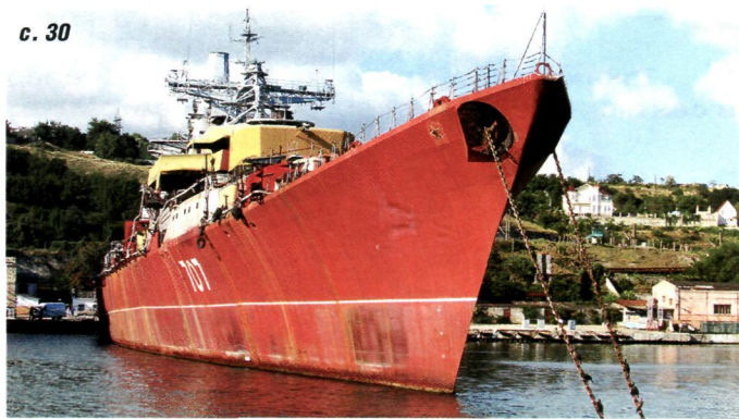
Законвертованный «Очаков» ожидал отправки на разделку...

уникальный, определённых параметров, инвентарь. Некоторые хотят выделиться индивидуальной графикой и формой лыж. Так родилась идея технологии «hand made».