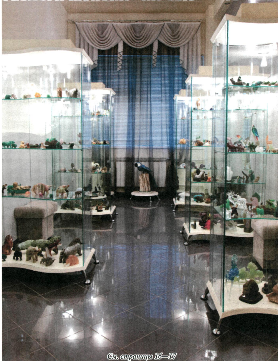
См. страницы 16–17