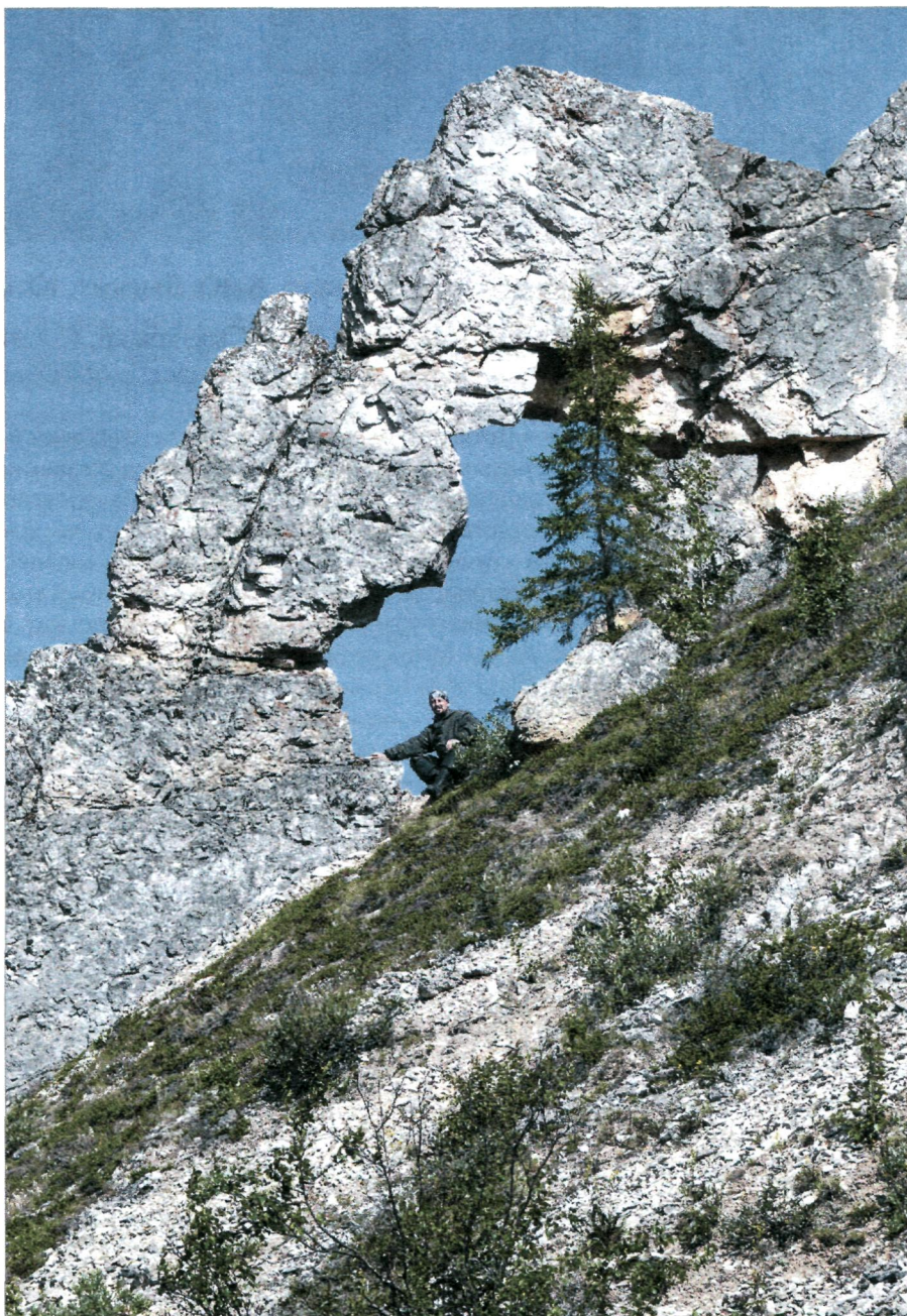
Река Шарью, скала Окно.