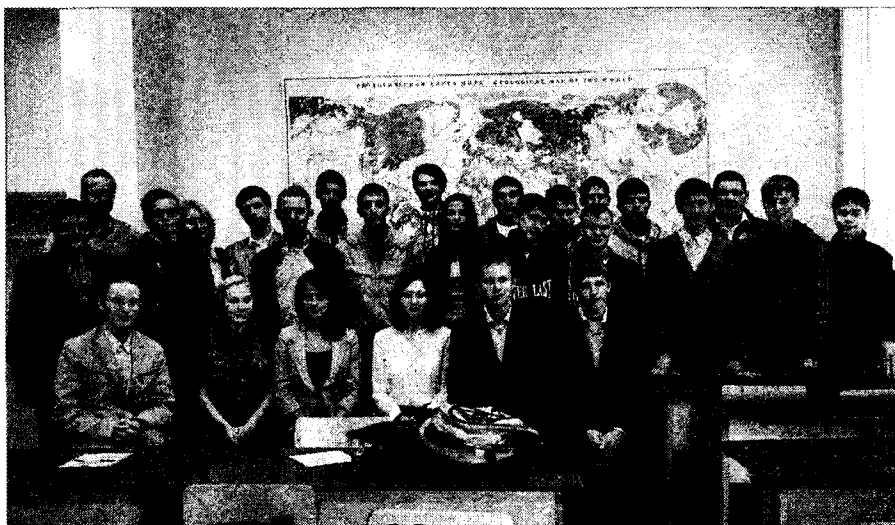
Первокурсники-геологи — набор 2013 года