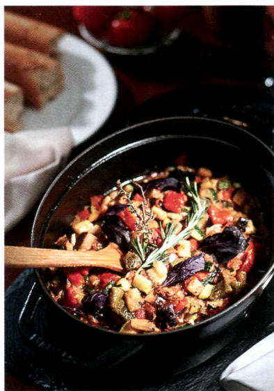
㉑ Рецепт рататуй из Ниццы . . . . . 84