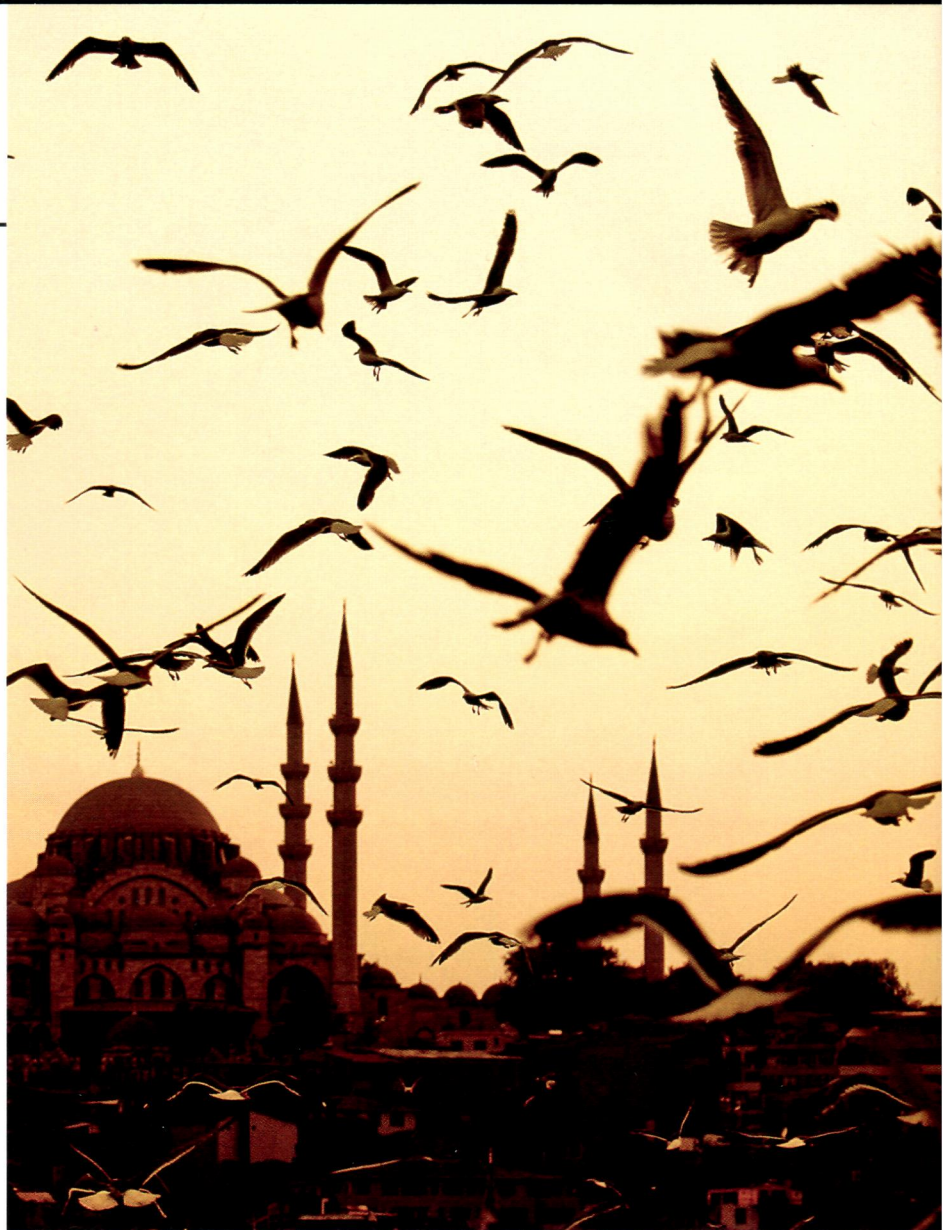
⑳ Семь чудес Турции: самое маленькое море, самая большая мечеть, самое соленое озеро . . . . . 32