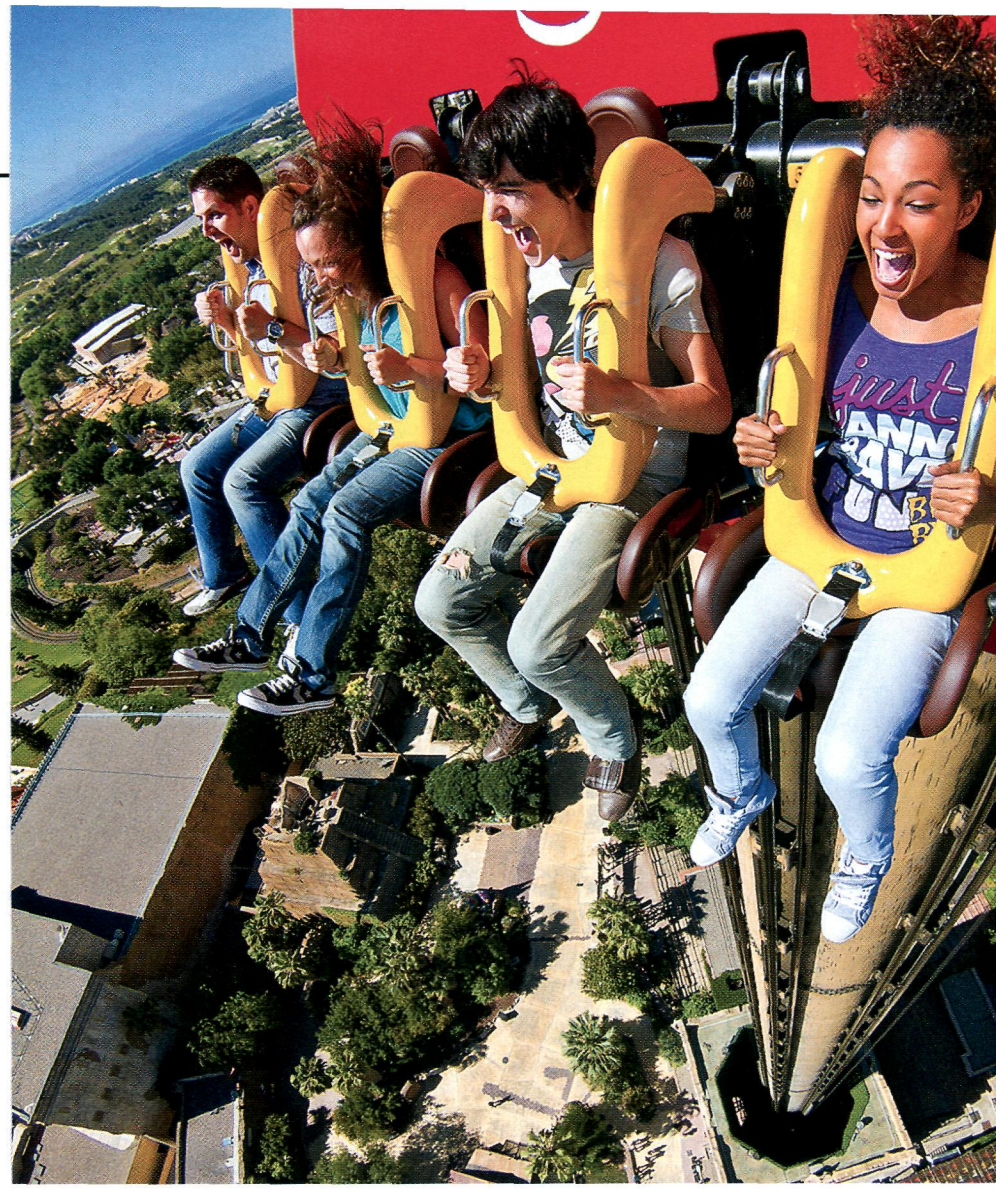
Вот это аттракцион! Лучшие парки развлечений в мире . . . . . 80