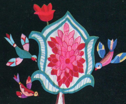
Фрагмент вышивки из поселка Бетлица